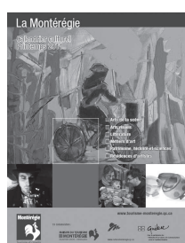
Calendrier culturel – Printemps 2011 255 activités diffusées