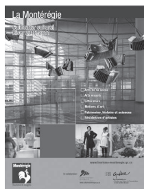
Calendrier culturel – hiver 2010-2011 216 activités diffusées