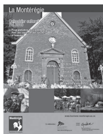
Calendrier culturel – été 2010 274 activités diffusées

En collaboration avec Tourisme Montérégie, le CMCC a poursuivi, pour une sixième année consécutive, la production de son Calendrier culturel dans un format de 20 pages en quatre couleurs, sur papier glacé, avec un tirage de 25 000 exemplaires à l'automne, à l'hiver et au printemps et un tirage de 40 000 exemplaires à l'été (dans un format de 24 pages).